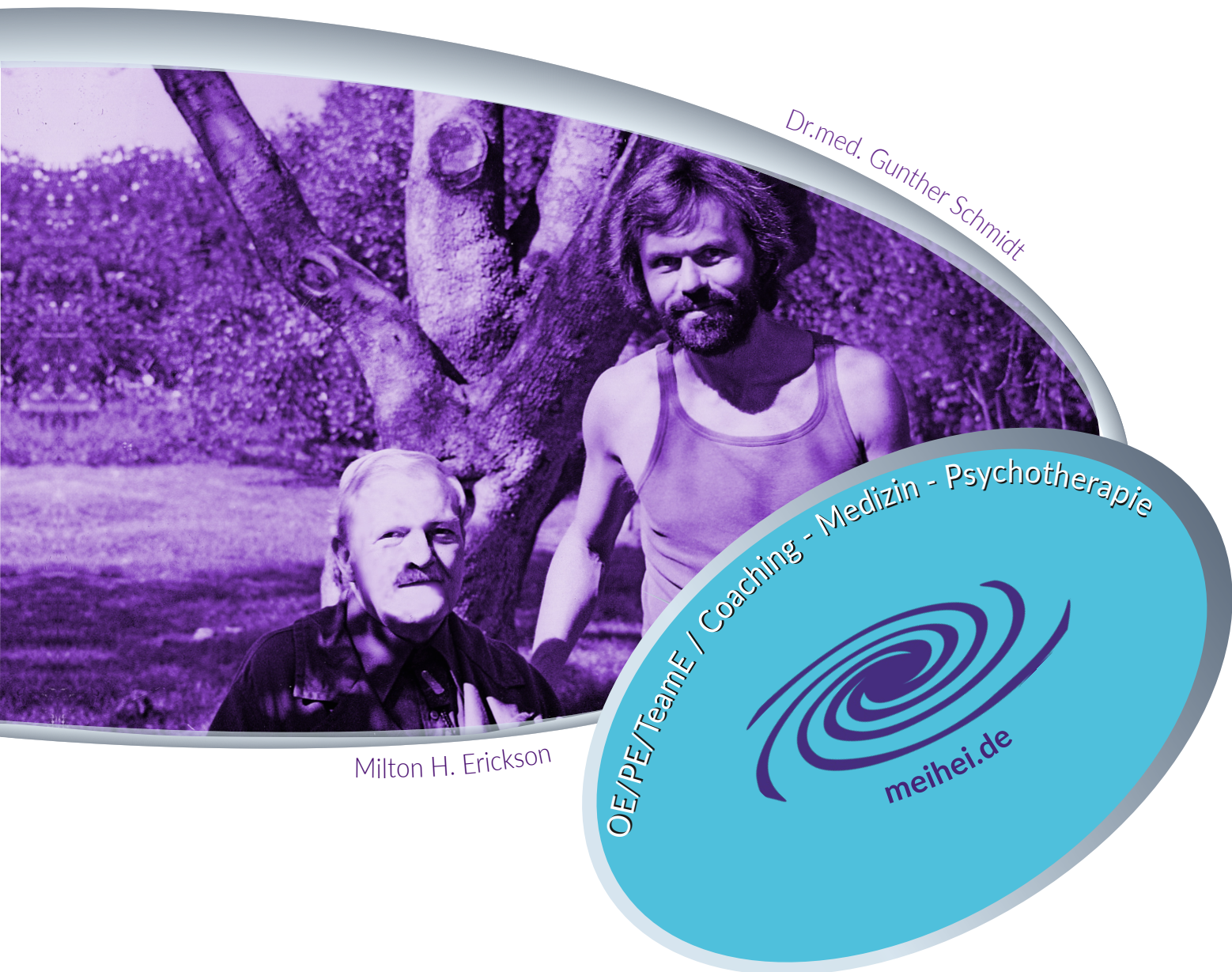
Milton H. Erickson